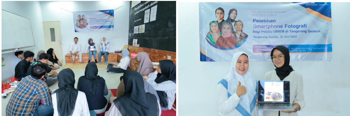
Gambar 4. Evaluasi Hasil Karya Peserta dan pemilihan Karya Terbaik