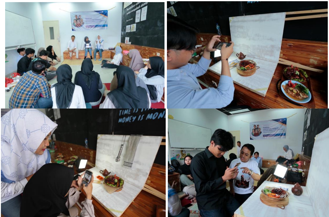
Gambar 3. Pendampingan teori dan praktika fotografi