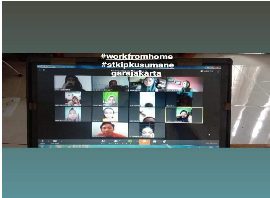
Gambar 3. Join meeting mata kuliah sosiologi dan antropologi

Melalui zoom dijadikan pembelajaran online jarak jauh menjadikan pembelajaran lebih efektif. Hal ini karena zoom menyediakan video konferensi yang dapat dijangkau oleh seluruh partisipan atau mahasiswa dan dosen. Selain itu, rekaman video pun terjaga keamanannya dan memiliki fitur chatting sehingga jika ada yang mendapatkan pendengaran dengan baik pada saat video konferensi maka dapat berbicara melalui chatting. Dalam zoom dapat pula dilakukan penjadwalan meeting berikutnya yang akan dilakukan. Dengan memanfaatkan pembelajaran online ini, tentunya menjadi solusi yang sangat inovatif di tengah pandemi covid 19 yang menuntut masyarakat untuk work form home termasuk kegiatan pembelajaran di perkuliahan melalui online .