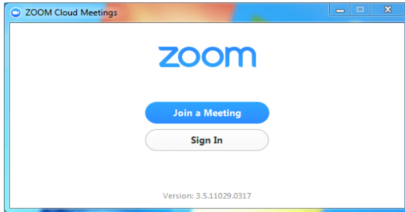
Gambar 1 Tampilan Awal Zoom

Volume : 06 Nomor : 02 Bulan : Mei Tahun : 2020 http : //ejurnal.pps.ung.ac.id/index.php/AKSARA/index