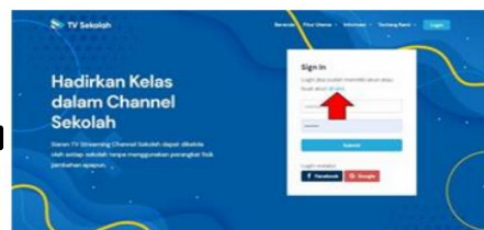
Gambar 3. Membuat akun, untuk Buat Akun Baru: Klik di sini