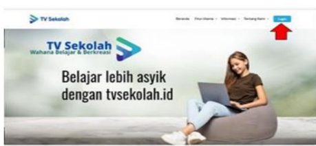
Gambar 2. Buka halaman tvsekolah.id: Klik Login

Berikut tahapan cara membuka chanel TV Sekolah dengan tahapan sebagai berikut (Channel, n.d.):